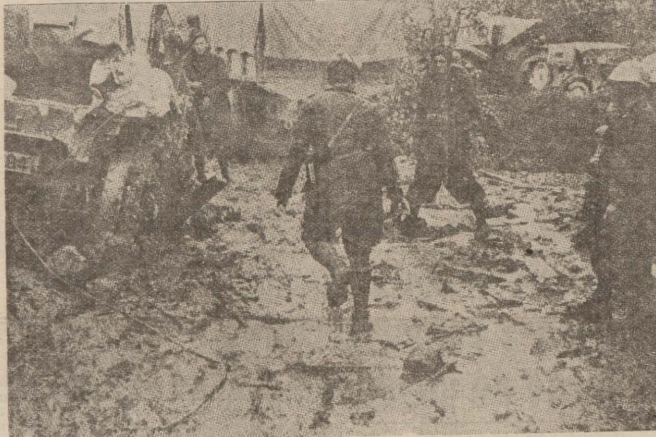
Arnavudlukta ric'at ederken çamurlara saplanan bir İtalyan tankı

Ankara 24 (Hususi) — Millî Şef İsmet İnönü bu sabahki şehrîmizde yapılan at yarışlarını şereflendirmiştir.